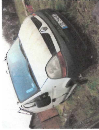
Zdjęcia samochodu Renault Master